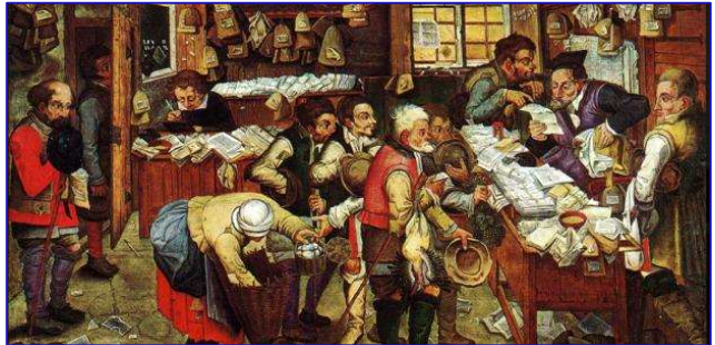
De betaling van de tienden ( Pieter Brueghel de Jonge , 1618)

Dit kan op rekening nr. : IBAN: BE50 6711 1790 7918 Adventkerk Gent Kortrijksepoortstraat 158 9000 Gent