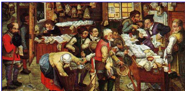
De betaling van de tienden ( Pieter Brueghel de Jonge , 1618)

Dit kan op rekening nr. : IBAN: BE50 6711 1790 7918 Adventkerk Gent Kortrijksepoortstraat 158 9000 Gent